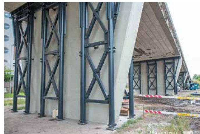
A pilléreket acélszerkezettel erősítették meg - az adással a Kertváros is fellélegezhet...

Ennek a problémának tett pontot a végére az október 27-i átadás, mert onnantól kezd-