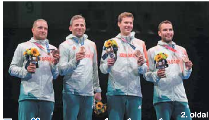
Együtt marad a kardcsapat 2. oldal

Interjú Szatmáry Kristóf országgyűlési képviselővel 4. oldal