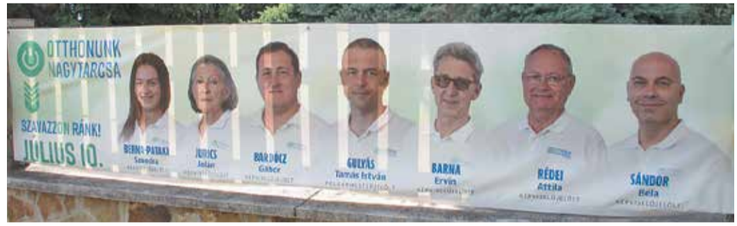
Az Otthonunk Nagytarcsa csapata egy Petőfi utcai ház kerítésén

A Fidesz tehát jelentős sikert ért el, és visszahódította a korábban elvesztett körzetet.