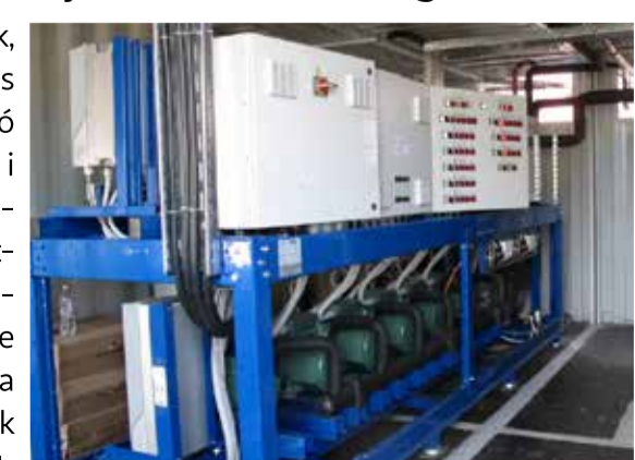
Az új, energiatakarékos hűtőrendszerek elektronikus vezérlő egysége. A hűtők részleges cseréje júniusban 21 százalékos energia-megtakarítást eredményezett

Ahogy arról már mi is beszámoltunk, az Auchan számára rendkívül fontos a fenntarthatóság és az erre való figyelemfelhívás. A mostani újításokkal, például a hűtőberendezések cseréjével, jóval környezetbarátabb működést tudnak biztosítani. Július végére szinte valamennyi régi hűtőt sikerül újra kiváltani, amivel csökkenteni tudják az áruház energia felhasználását. Természetesen ezen felül pedig egy sokkal szélesebb választékot biztosítanak a vásárlóknak.