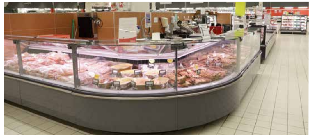
Az új pult

Július 7-étől egy különleges pulrendszer kezdte meg működését az áruházban, ahol a hal-, hentes- és csemegetermékek helyezkednek el. Ez az áruházat hosszában átszelő középső főfolyosóra nyúlik bele. Az átépítés után az élelmiszerosztály termékei erre a főfolyosóra kerültek, de ugyancsak itt látható a szintén felújított akvárium. Aki ugyanis az áruházláncban szeretne élőhalat vásárolni, könnyedén megteheti. Ráadásul mindemellett nagyon széles, különlegességeket is tartalmazó halkínálattal is várják a vásárlókat.