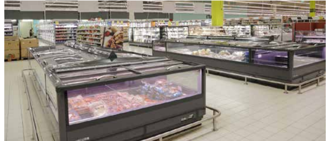
A korábbinál sokkal jobban belátható az egész eladótér

A hal-hentes-csemegepult átadásával továbbfolytatódik az átépítés az áruház paravánnal elválasztott részén. Július végén itt nyílik majd meg a mirelit univerzum, mégpedig a korábbi mirelit-részleghnél sokkal nagyobb alapterületen. A csemegepult korábbi helyén, a falak mentén végig hűtők sorakoznak majd, az előttük lévő területen pedig az alacsonyabb hűtők mutatják a kínálatot. Nagyon látványos lesz a választék bővülése ezen a területen is: a korábbi 550-féle termék helyett 700 mirelit-áruból válogathatnak majd a vásárlók.